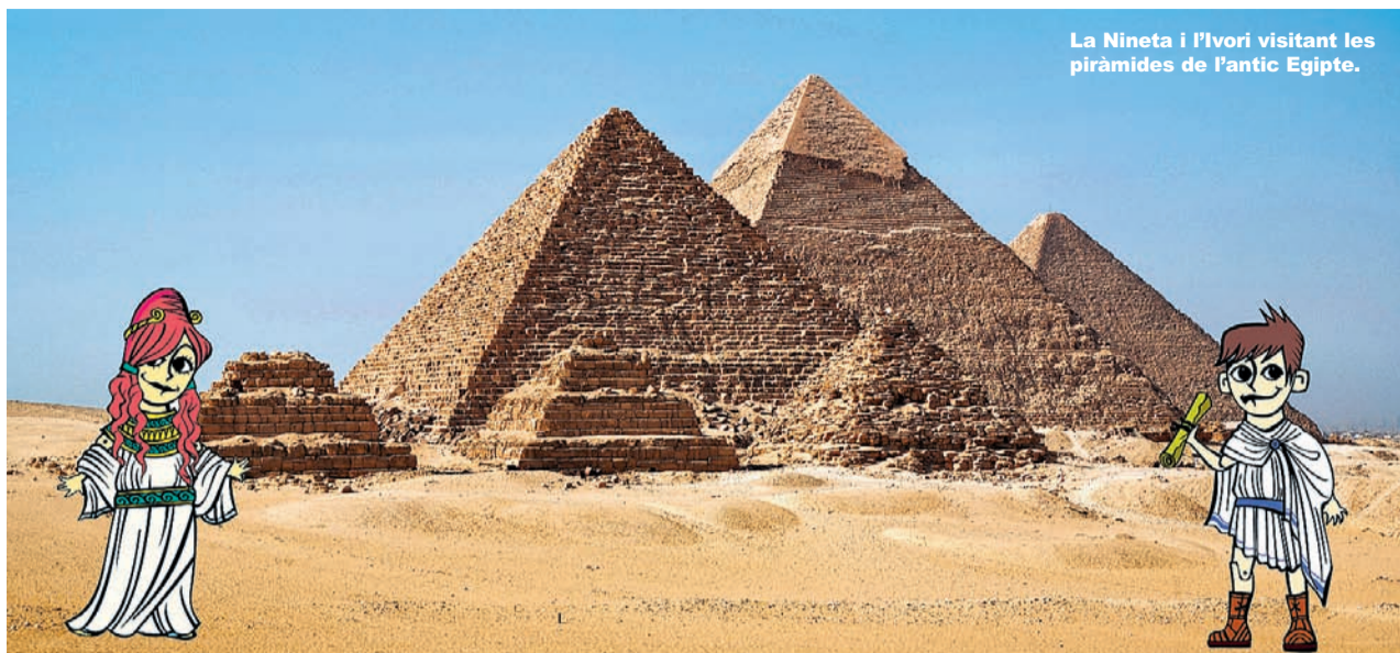
La Nineta i l'Ivori visitant les piràmides de l'antic Egipte.

Consulteu tots els actes del mes a www.tarraconins.cat